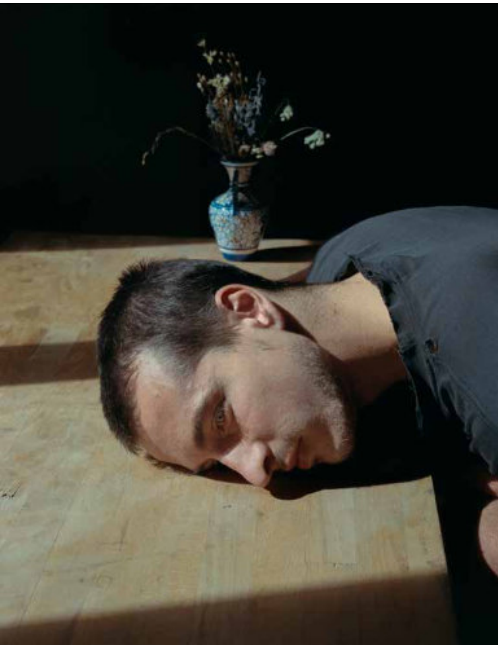
© Wouter le Duc, Ethno, Luke