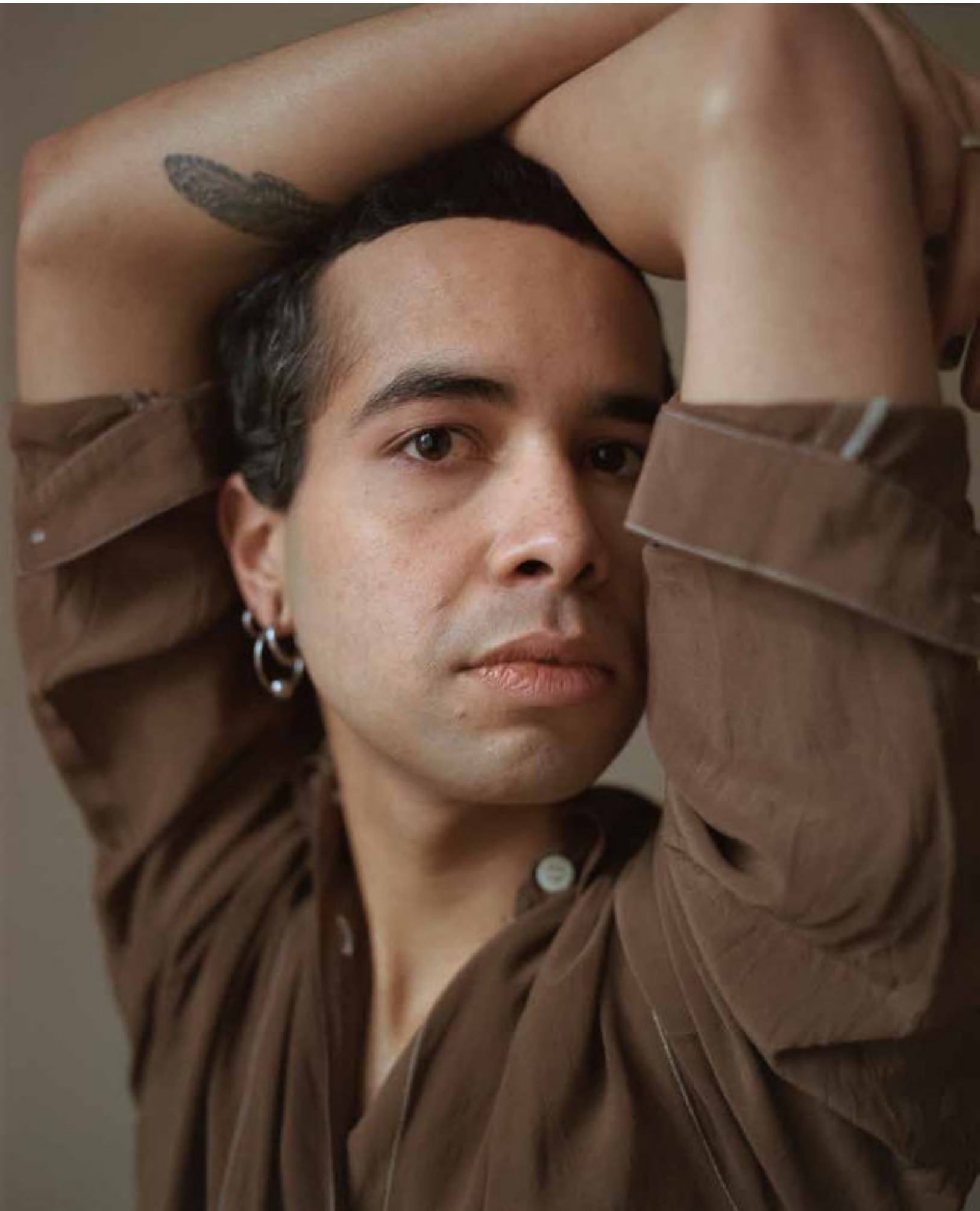
© Wouterle Duc, Fragmentsof a river, Manila