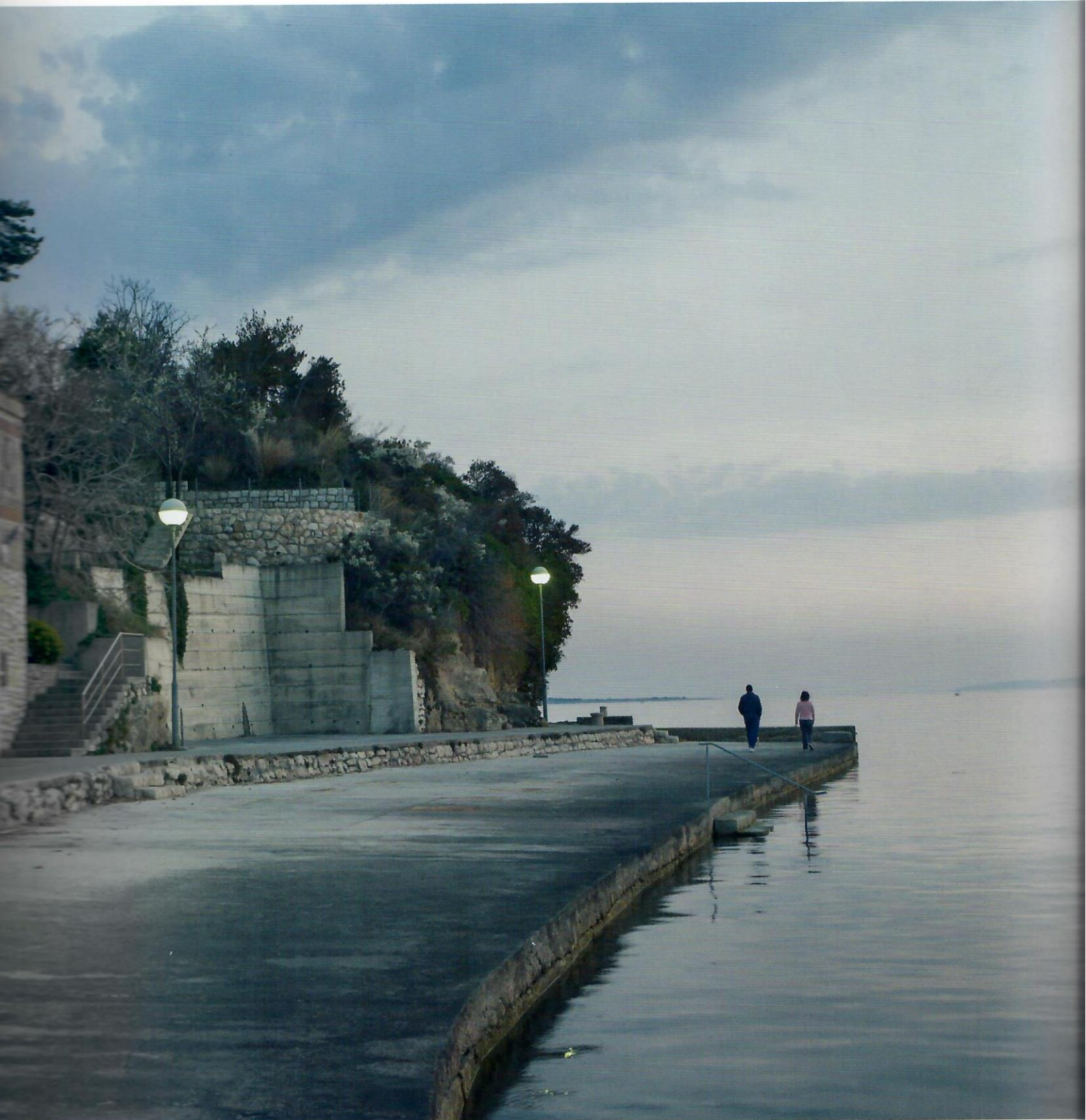
Faint, illegible text, likely a caption or description of the image above.