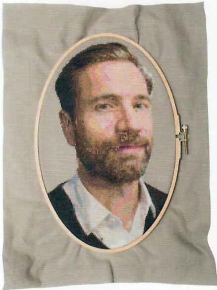
© Lana Mesić, Wizard of Oz 07