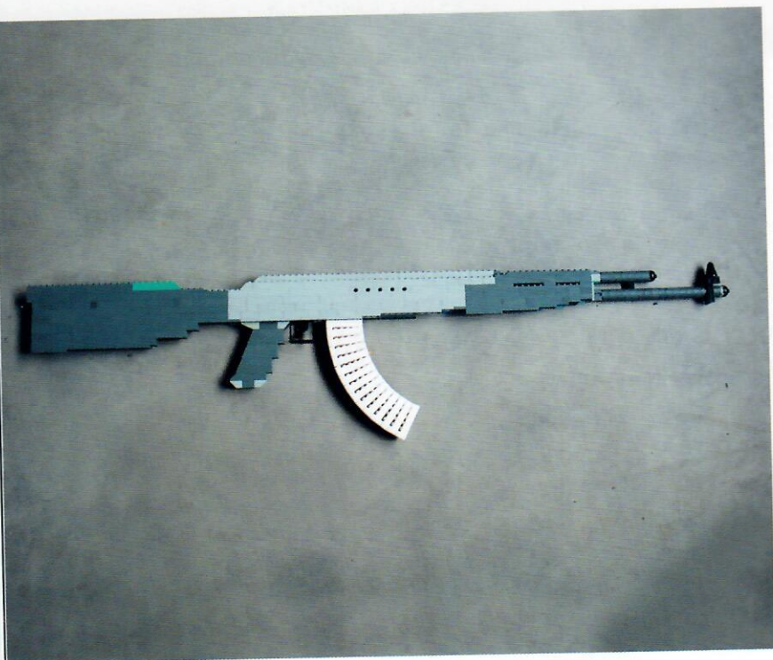
© Lana Mesić, Lego Kalashnikov 5