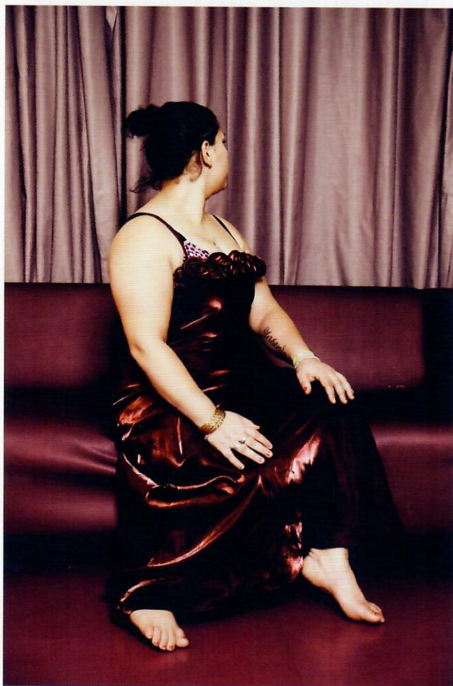
© Ernst Coppejans, Lady in red (Sold)