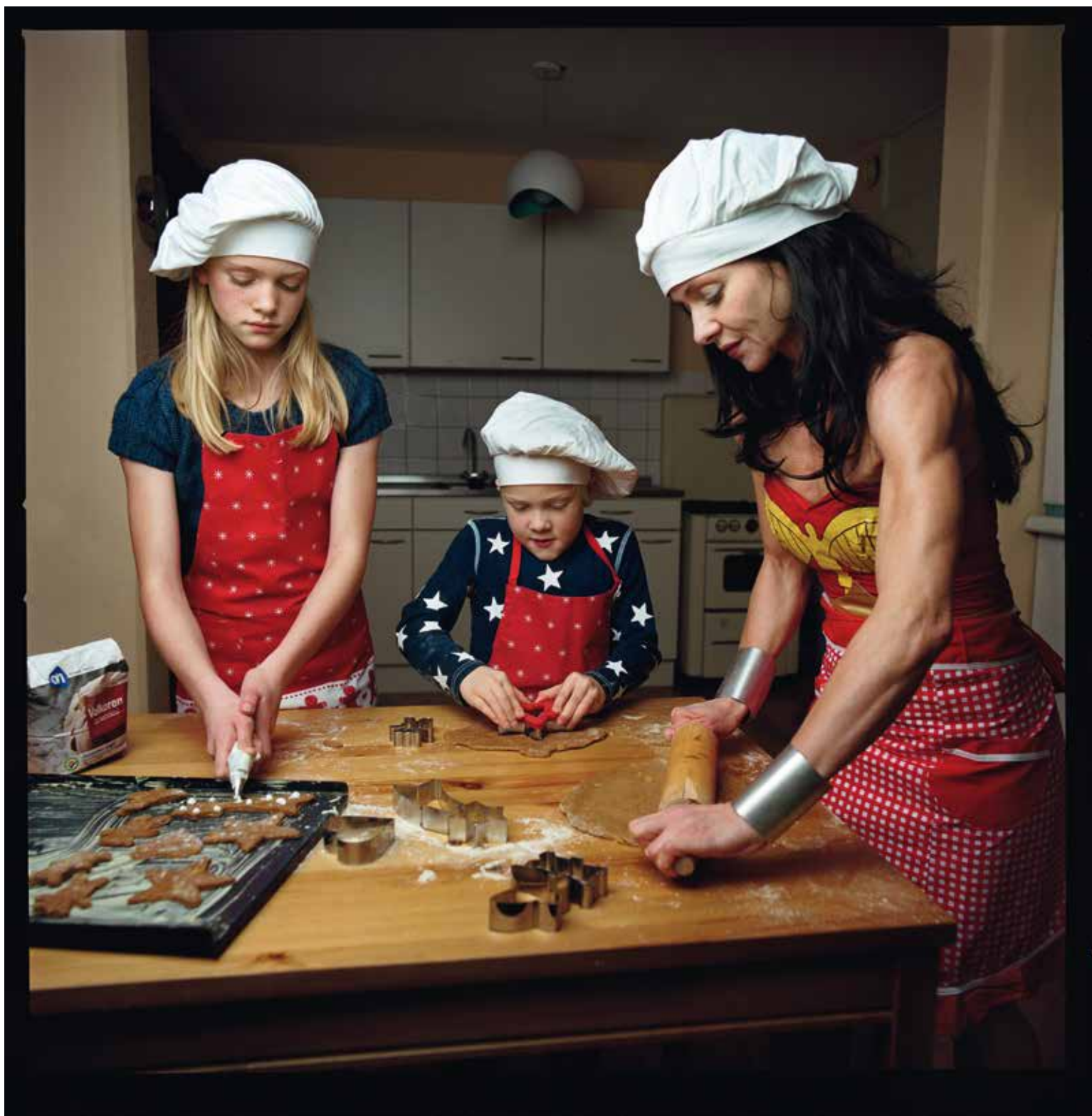
Wonder Woman Koekjes