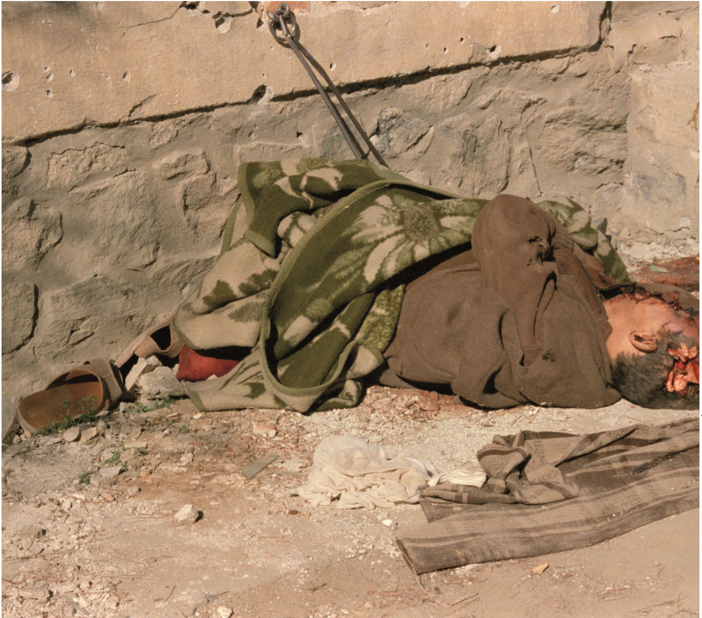
Burgeroorlog Afghanistan 1993-1994