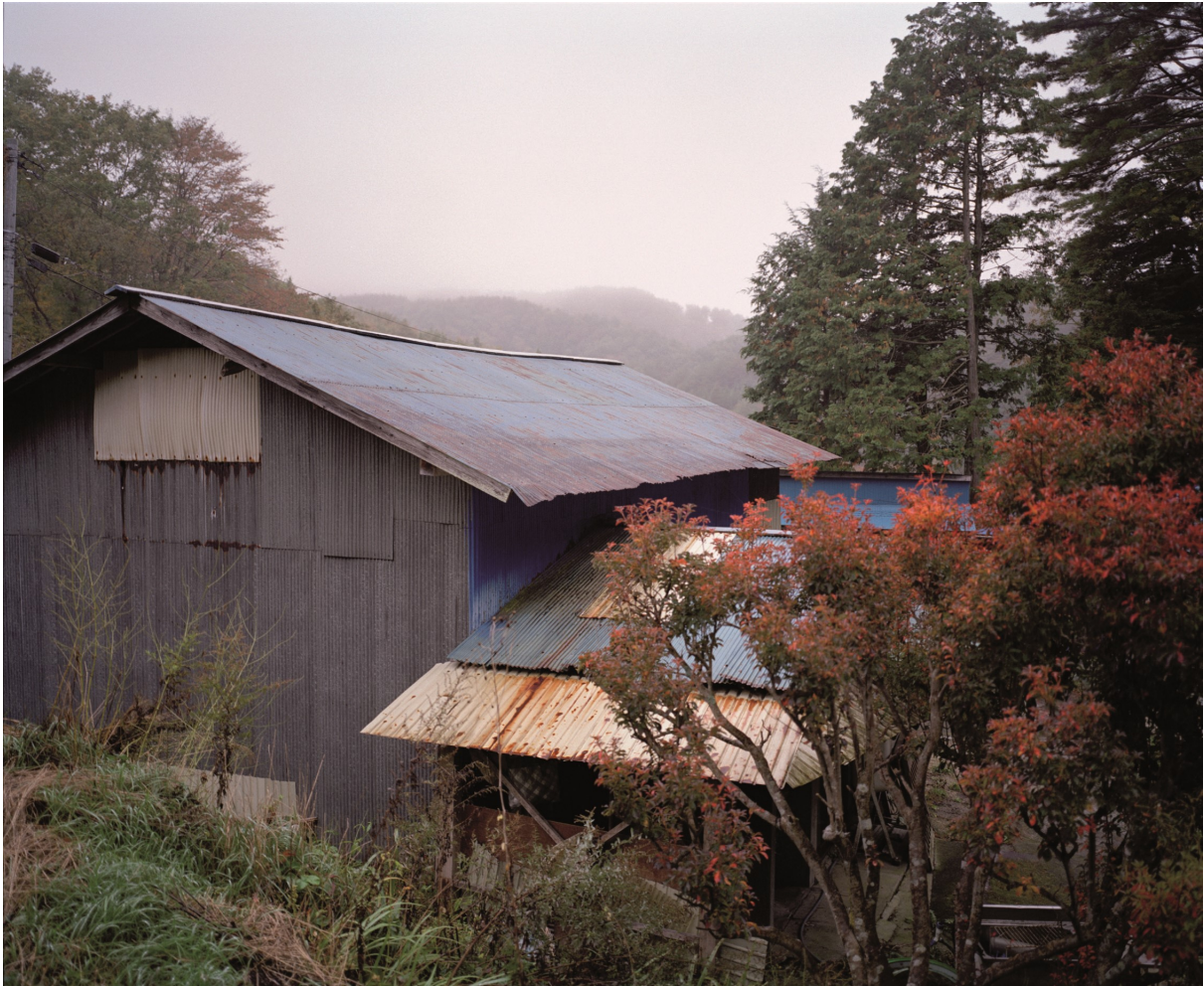
Verlaten boerderij aan de rand van de gesloten zone. Stralingsniveau 8-13 microsievert per uur