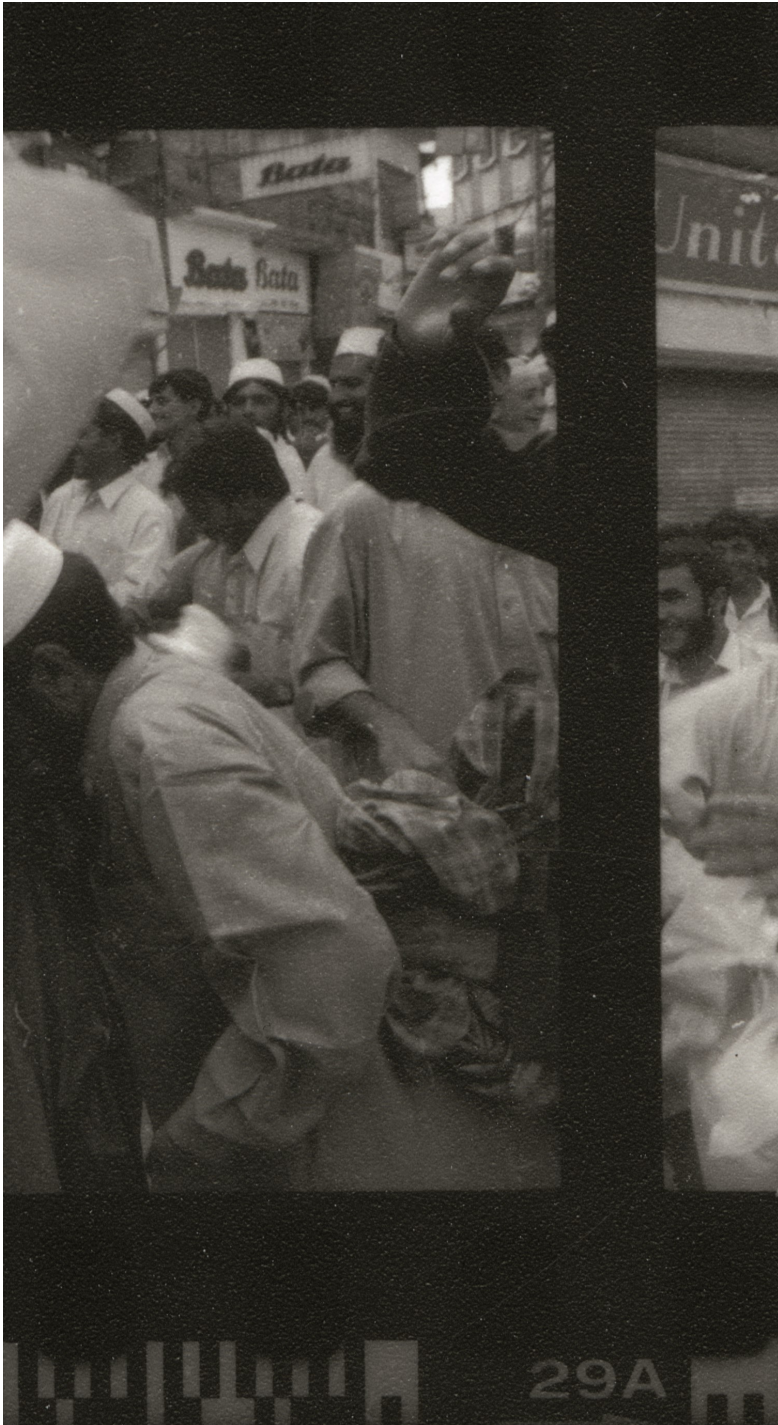
Anti Amerika demonstraties in Peshawar, Pakistan September 2001

“De clichés over het Japanse platteland zijn allemaal waar. Het landschap is gruwelijk mooi. Bijna idylle. Prachtig en in één keer is het weg, weggevaagd. Je ziet het niet aan de buitenkant. Mijn foto's tonen het paradijselijke landschap rond Fukushima. Ogenscheinlijk een plek vol rust en vrede tot je het stralingspercentage ziet. Dan word je in één klap geconfronteerd met de werkelijkheid. Inmiddels zijn er 200.000 mensen geëvacueerd, waarvan het uitermate onzeker is of zij ooit terug kunnen. Wanneer mensen worden gedwongen om huis en haard te verlaten, is dat zo ingrijpend. Dat kun je je niet voorstellen. Zeker in Japan waar sommige families al honderden jaren in hetzelfde boerendorp wonen. Hele hechte gemeenschappen worden ineens uit elkaar gerukt. In Nederland zien we ons land meer als een gebruiksartikel. In Japan kijkt men daar heel anders tegenaan. Er is een heel delicaat evenwicht tussen hoe de boeren werken en leven in hun omgeving. Dat maakt het verhaal veel dramatischer. De impact op dat soort gemeenschappen is veel groter dan het hier zou zijn. Ik wil graag het verhaal vertellen van die idyllische omgeving in Japan en het wankel evenwicht tussen mensen en omgeving. Maar ook het verhaal van de mensen die achterblijven en het verval van de dorpen. De fundamentele vraag is: zet je alles op het spel om op die manier in je energievoorziening te voorzien? Voor die mensen is het uiteindelijk geen vooruitgang.