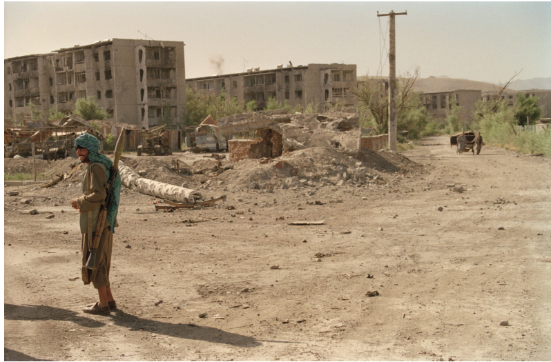
Burgeroorlog Afghanistan 1993-1994