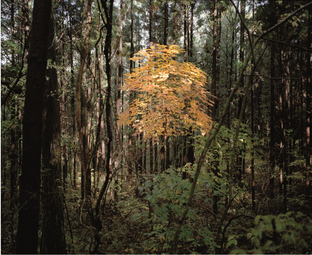
Bos nabij Tsushima, Stralingsniveau 2.3 tot 3.0 microsievert per uur