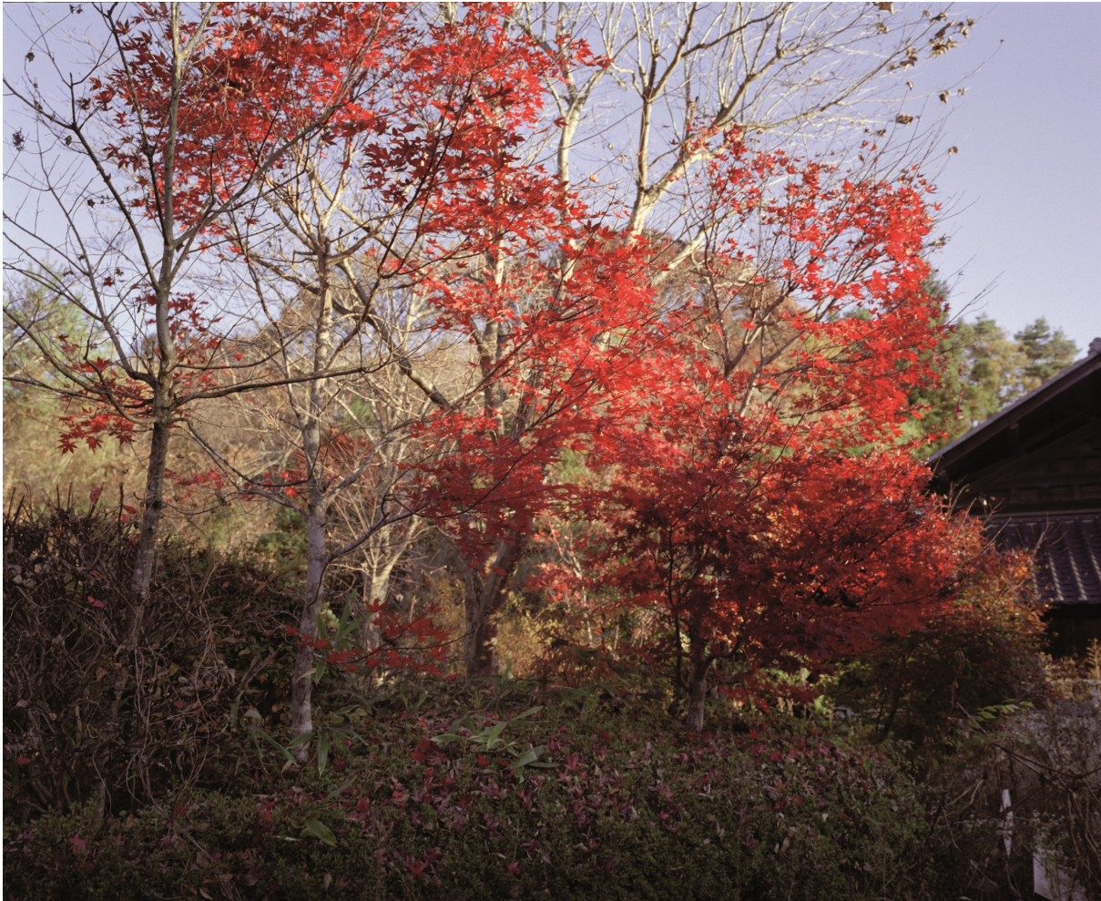
Tuin in het centrum van Tsushima. Stralingsniveau 5.0 microsievert per uur

gaat het vooral om het oplossen van echtscheidingsproblemen, erfenissen, familieruzies en de schapen van de burens die op andermans land grazen. Dat is toch een soort van rijdende rechter. Mensen vragen mij vaak waarom ik dit doe. Ik ben daar gewoon in mijn element. Als wij de film Lawrence of Arabia zien, kijken we elkaar aan en zeggen we: 'het wordt weer eens tijd om te gaan'. Wat mij raakt en nog steeds verbaasd is dat mensen je altijd ter wille zijn. Er zijn heel veel mensen die er alles voor zullen doen om je verder te helpen. Soms voel ik me daar heel ongemakkelijk over. Het zijn allemaal mensen zoals jij en ik. Hoe zou jij in zo'n situatie reageren? Dat willen we in Poppy graag laten zien. Dat de keuzes die de mensen daar maken niet zo dramatisch verschillen van de keuzes die wij hier maken. Het ligt vaak veel genuanceerder en moeilijker dan het lijkt. Ik weet niet wat ik gedaan zou hebben als ik in Afghanistan geboren zou zijn.