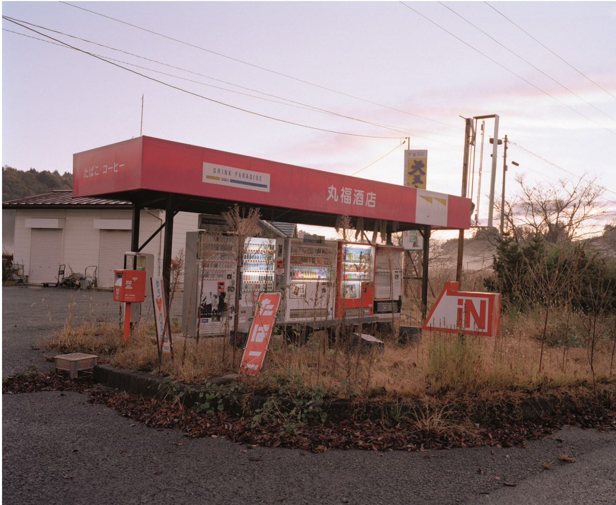
Benzinestation in Tsushima. Stralingsniveau 6.0 microsievert per uur

Oorlog is echt een mannending, een klein jongetjes- ding. Als je je leven op het spel zet voor een krant, dan moeten ze daar zwaar voor betalen