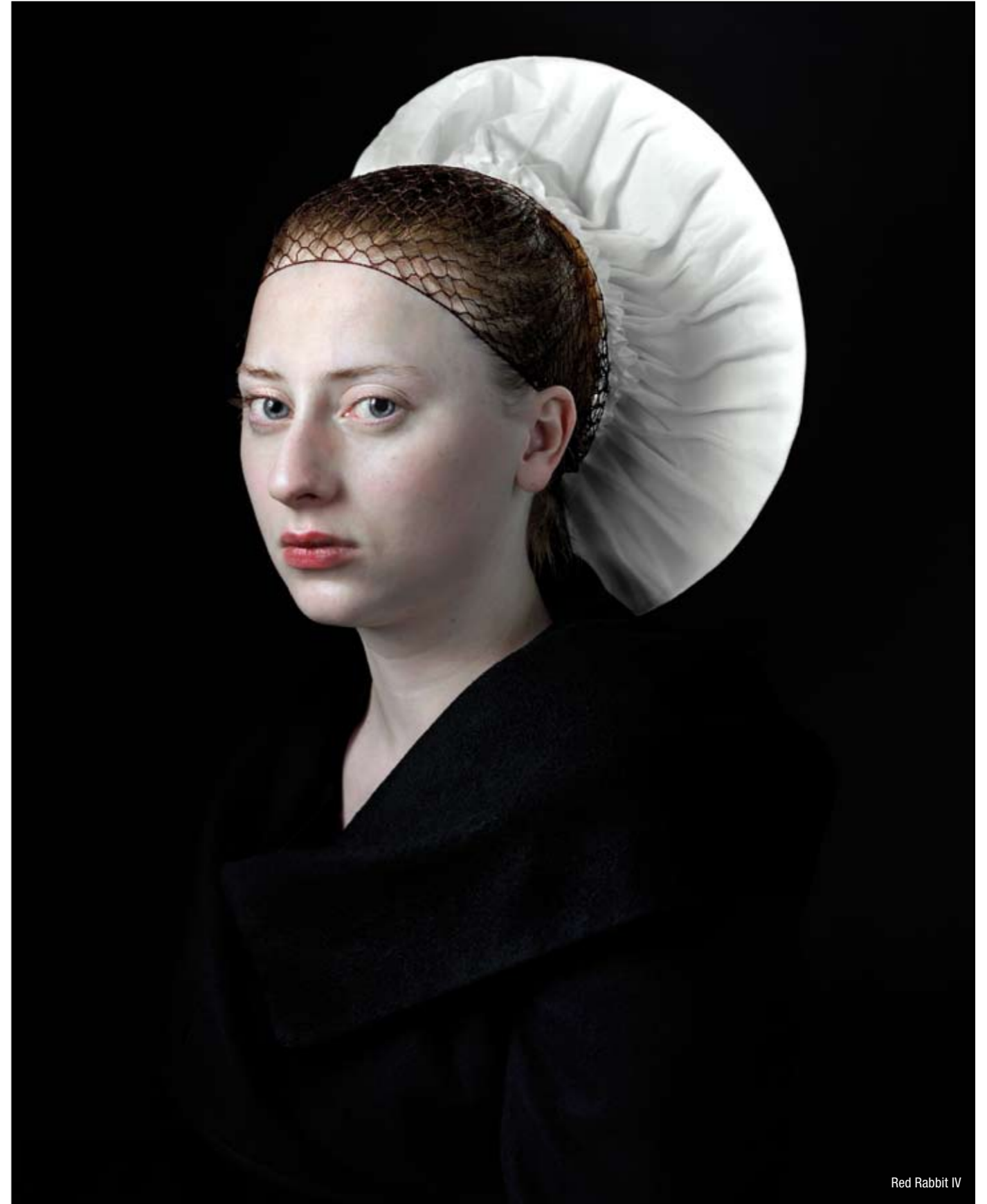
Red Rabbit IV