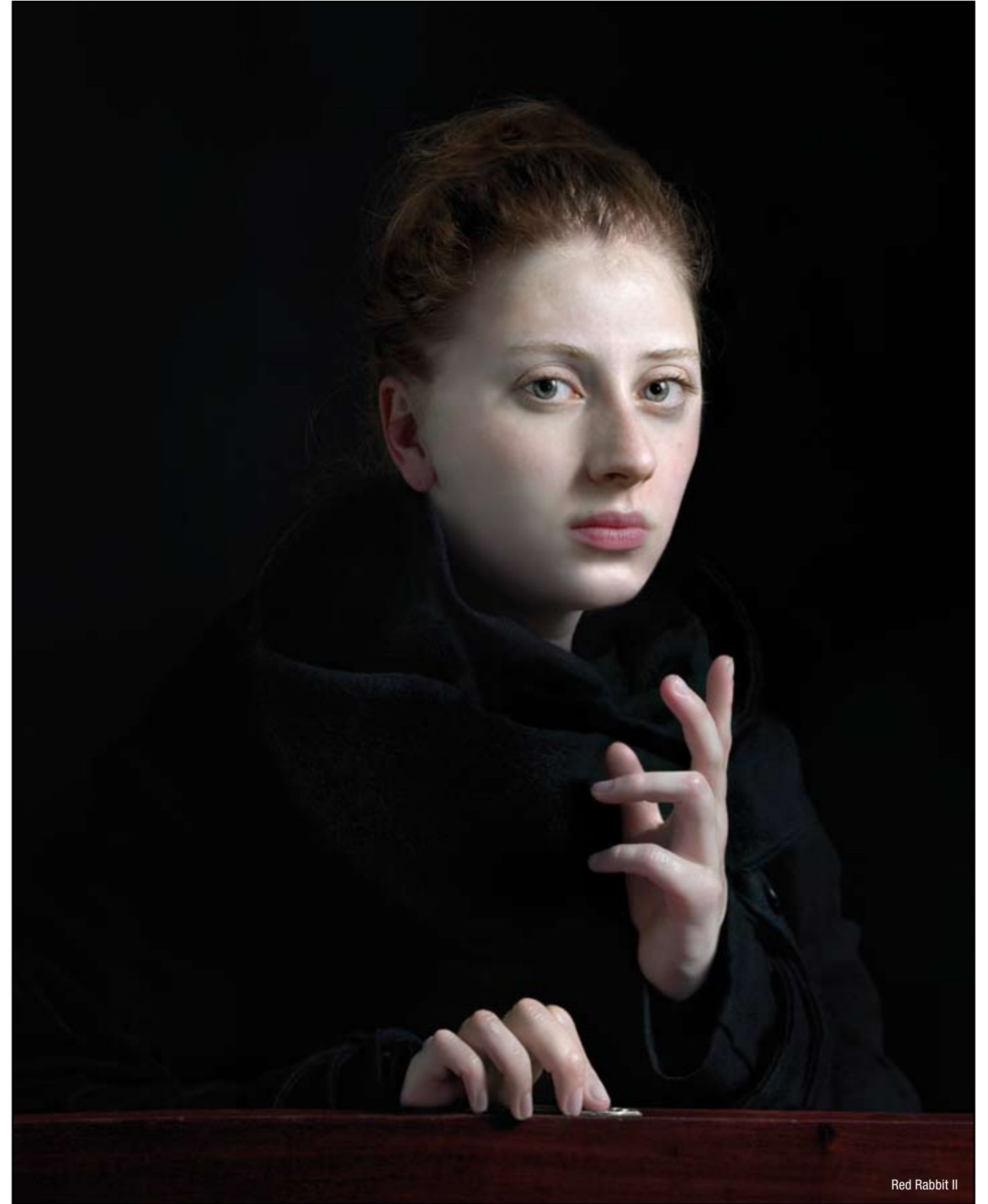
Red Rabbit II