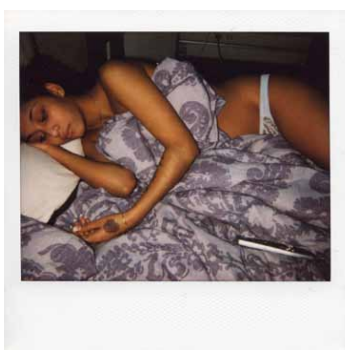
Martijn van der Griendt fotografeert uitsluitend op Polaroid