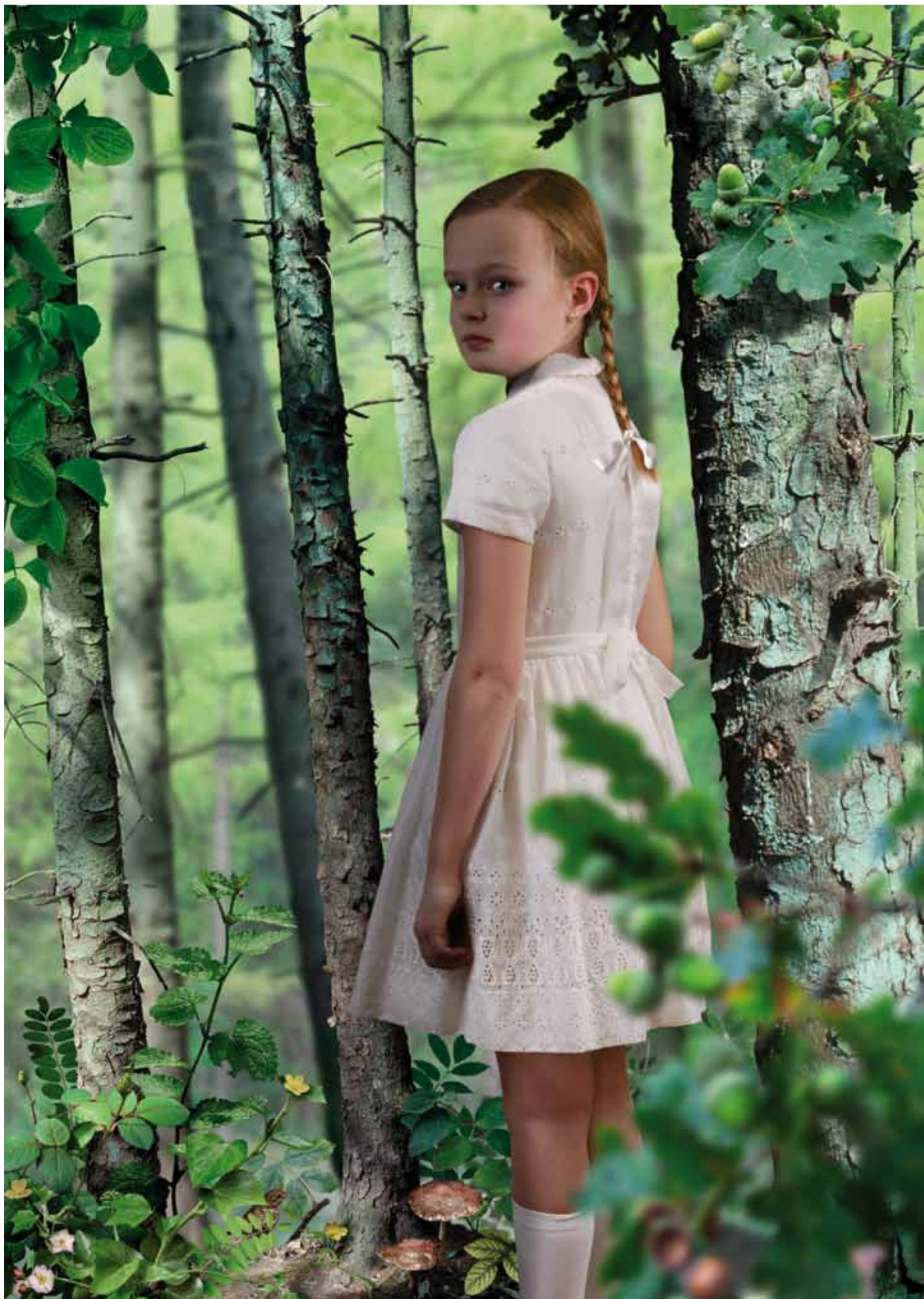
Ruud van Empel, Untitled #2, 2004, Cibachrome, 118,9 x 84,1 cm, Courtesy Flatland Gallery (Utrecht, Paris)