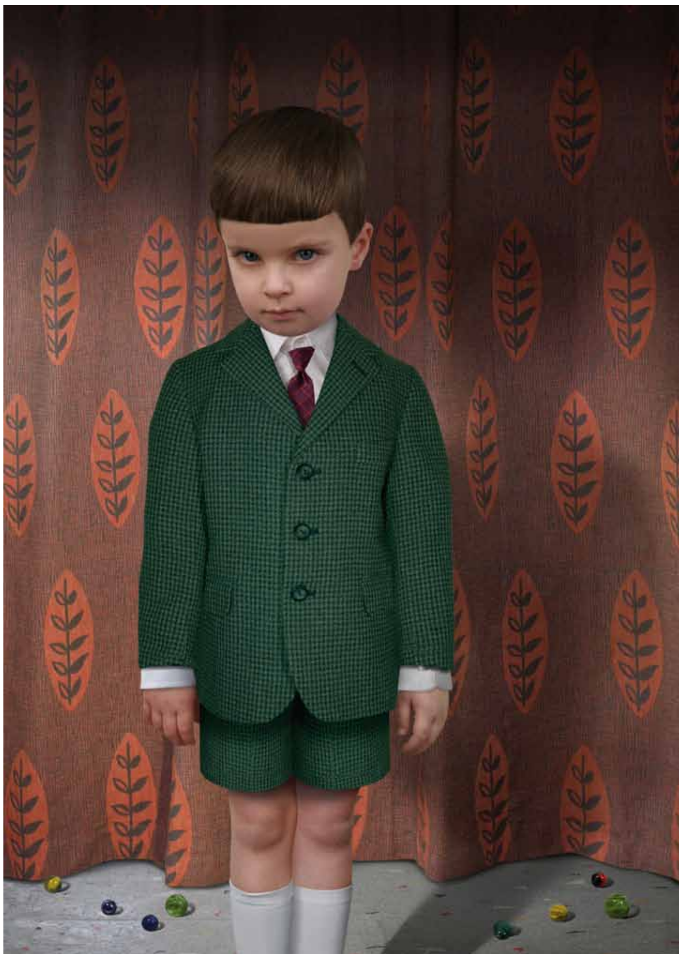
Ruud van Empel, Souvenir #1, 2008, Cibachrome, 84 x 59,5 cm, Courtesy Flatland Gallery (Utrecht, Paris) →