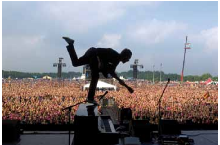
Editors 31 mei 2008 Pinkpop