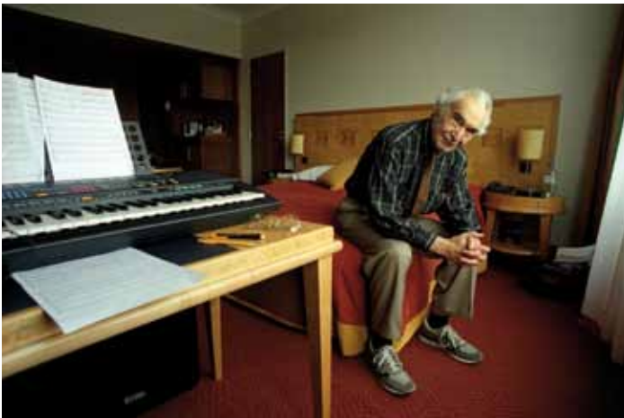
Dave Brubeck 24 april 2000, Amsterdam