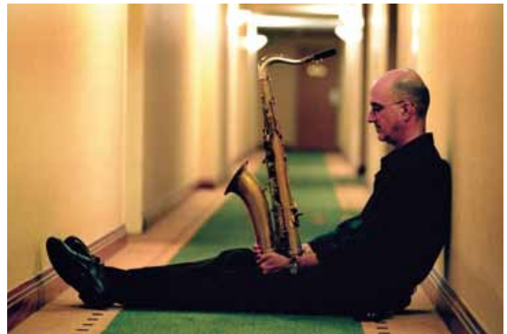
Michael Brecker 9 mei 2001, Brussel