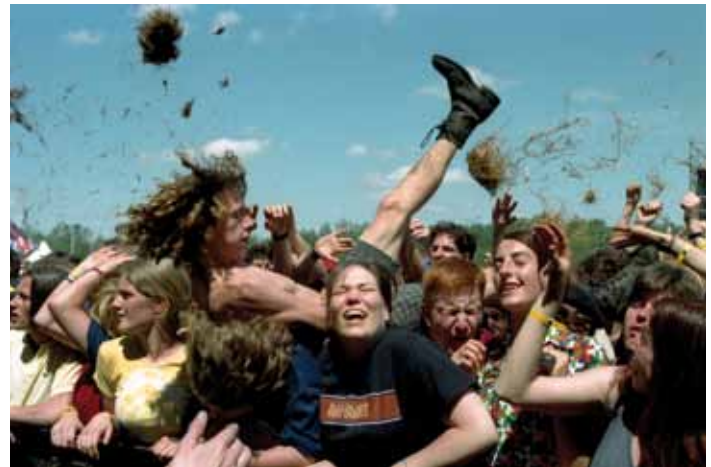
Pinkpop 18 mei 1997, Landgraaf