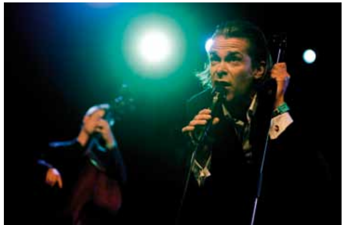
Hans Teeuwen 11 juli 2008 North Sea jazz Festival, Rotterdam →