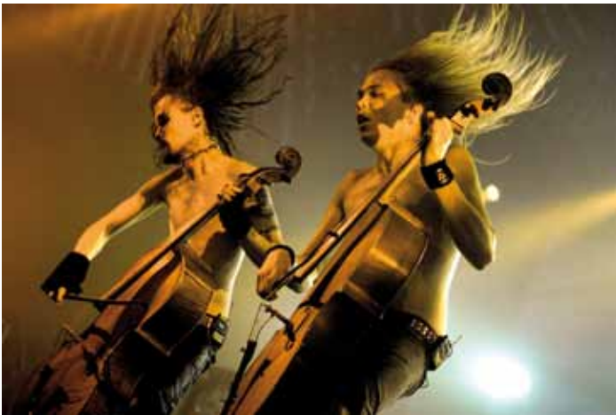
Apocalyptica 20 augustus 2005 Lowlands