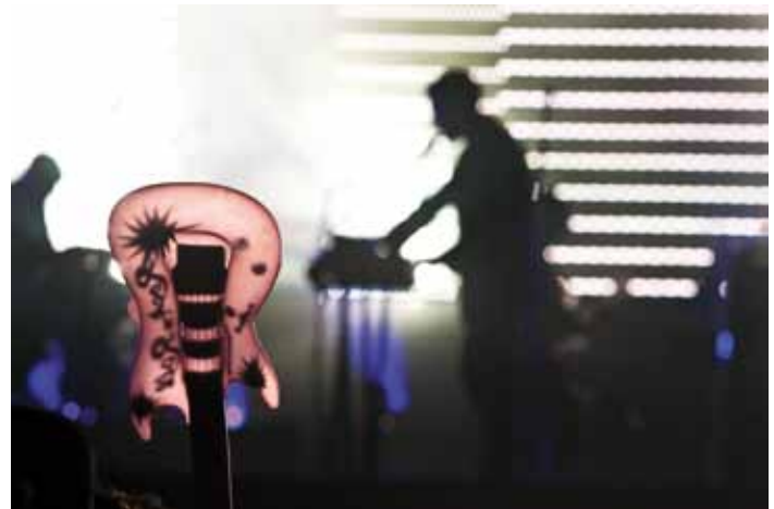
Lowlands 22 augustus 2010, Biddinghuizen