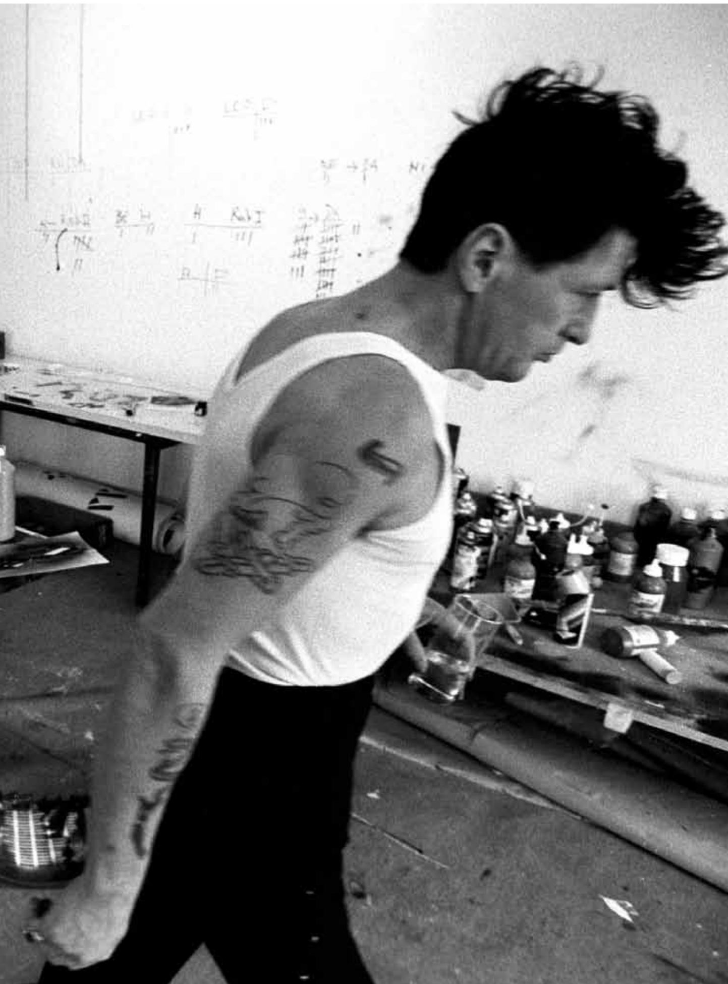
Herman Brood →