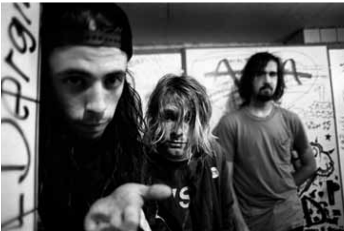
Nirvana 12 november 1991, Frankfurt