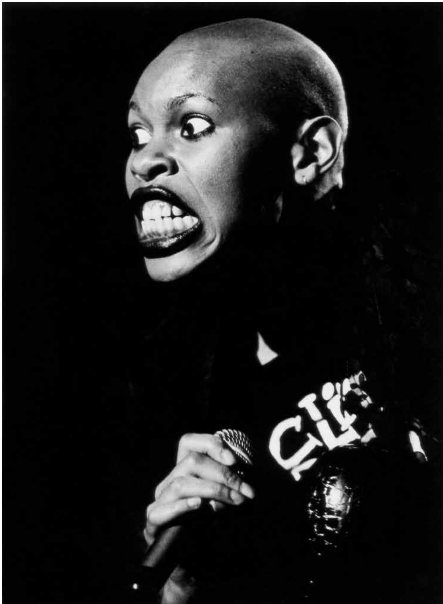
Skunk Anansie 8 april 1996 Ahoy