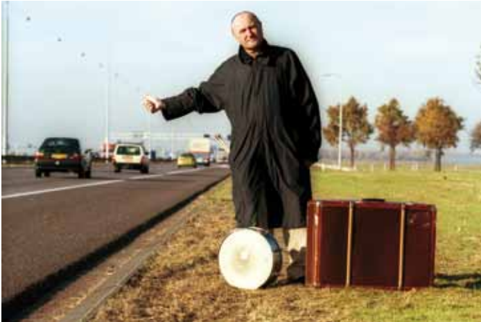
Phil Collins 2003 Langs snelweg A1