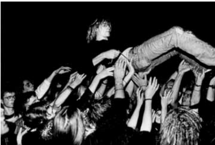
Nirvana 12 november 1991, Frankfurt