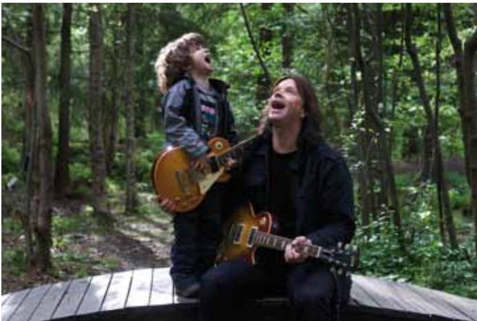
John Norum 19 mei 2009, Stockholm