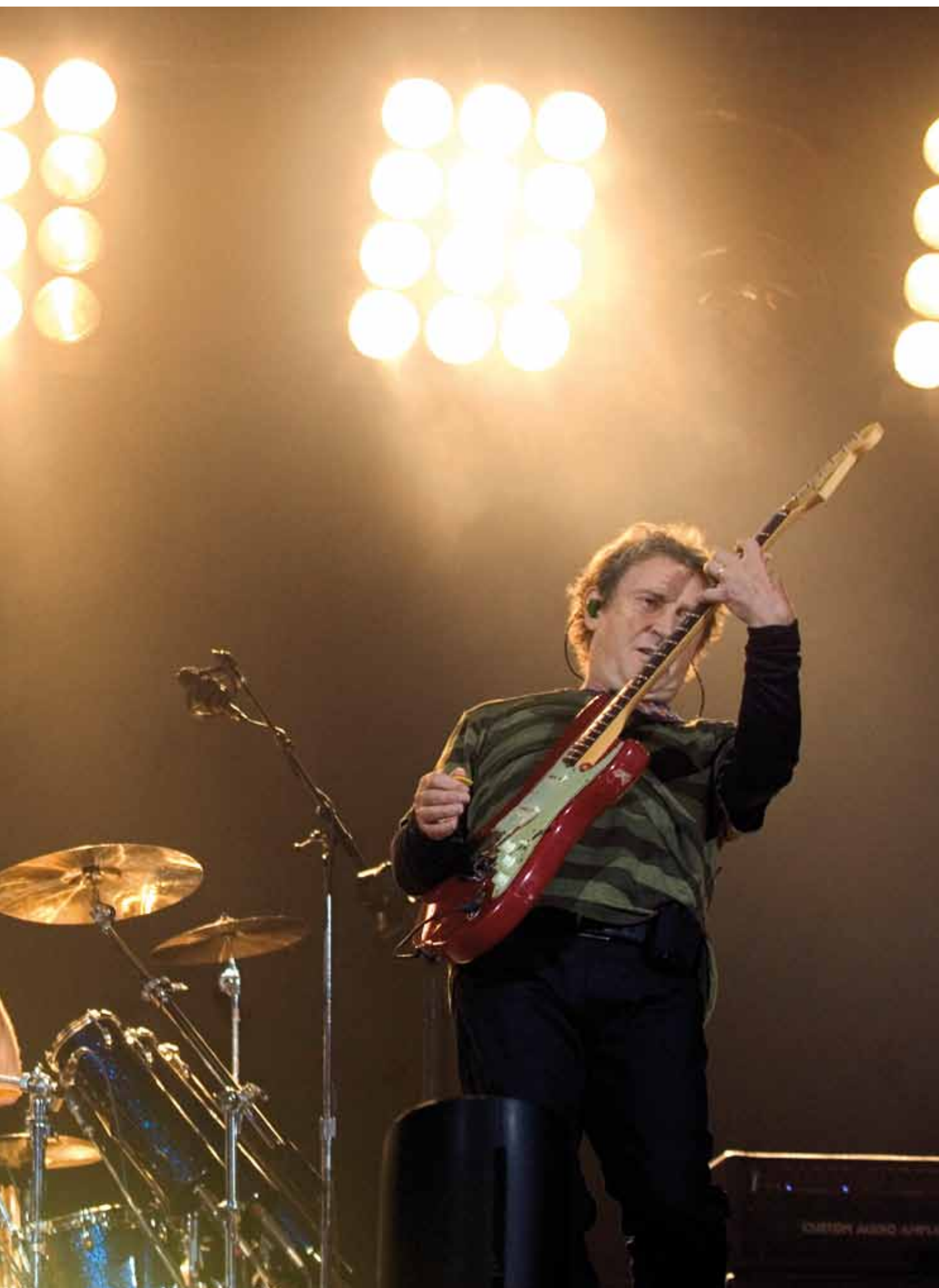
The Police 13 september 2007 Arena, Amsterdam →