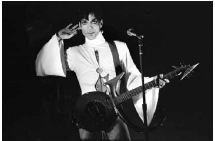
Prince 24 maart 1995, Den Bosch